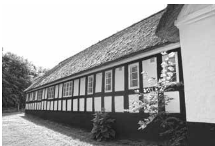
Nordvæggen af den gamle bindingsværksbygning 2014.