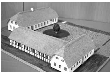
Model af Thyregod Præstegård 2014.