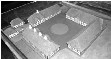
Model af Thyregod Præstegård 1792.