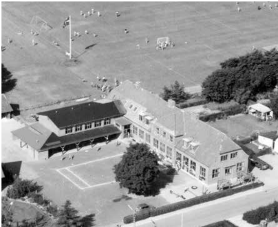
Farre Skole fra 1944 var den tredje skole i Farre siden 1871. Da skolen stod færdig blev den, som mange af områdets andre skoler under Anden Verdenskrig, besat af tyskerne. Skolen lukkede i 1989.

de nye elever. Cykler og busser muliggjorde, at også de yngste elever kunne have en længere skolevej.