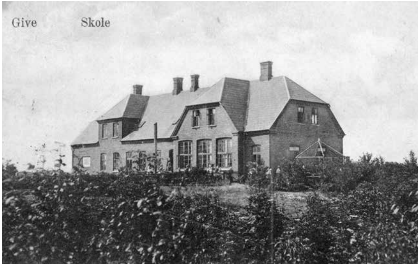
Give Skole lå fra 1901 på Rådhusbakken, der dengang hed Skolebakken. På trods af flere tilbygninger var bygningen i 1939 ikke længere tidsvarende, og en ny blev opført samme sted. Eleverne blev i perioden 1939-1941 undervist rundt om i byen, mens den nye skole blev bygget.

hvor børnene boede. Set med nutidsøjne var skolerne små, og der blev oprettet mange af dem. I 1901 var der cirka 30 skoler i de sogne, der fra 1970 blev til Give Kommune. Skolebygningerne afspejler naturligt den tid, de er bygget i, men byggestilen fortæller også om skole- og undervisningspolitik – og samfundsudvikling.