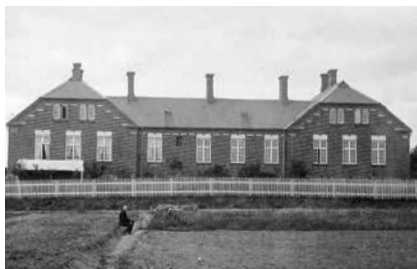
Give Amtssygehus 1907, bygget 1894.

Byen var ikke til at kende. Det gamle centrum omkring Torvet og Østergade blev forlænget ned gennem Vestergade, og det var ikke længere de lave gårde, der dominerede billedet, men moderne stationsbysbyggeri, ofte i flere etager. Mange af de nye familier, der kom, havde børn, så der måtte bygges en helt ny skole, der blev lagt på bakken oven for Torvet. Vejen derop fik naturligvis navnet Skolebakken, og da rådhuset siden rykkede ind på stedet, blev gaden til Rådhusbakken. Skolen blev ligesom sygehuset bygget i en markant stil, der osede af bystil og institution. Der kom også en metodistkirke i Nørregade, men