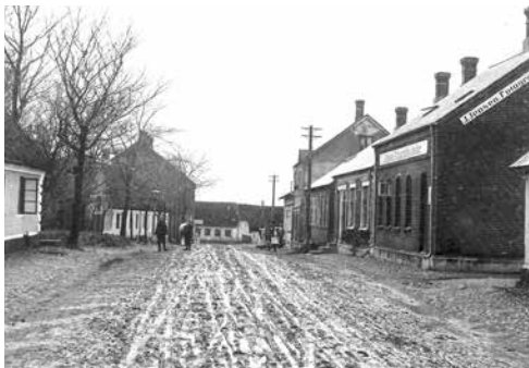
Vestergade, Bartels album 1907.

Jo, Give var blevet en rigtig by, der havde det hele.