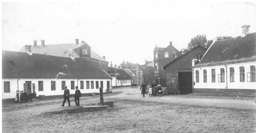
Torvet omkring 1910. Bag de lave gårde (den gamle kro tv. og den nye kro th.) ses de moderne bygninger i flere etager i Vestergade.

sygehuset og eleverne på højskolen blev simpelthen kaldt ”tjenestetyende”. Et godt kendt ord, men noget misvisende.