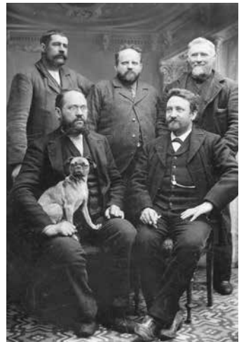
Givø håndværkerforening o. 1890.

I de første år mødtes man på Givø kro, men allerede i 1891 købte man en grund i Torvegade og fik sit eget hus. Det lig-