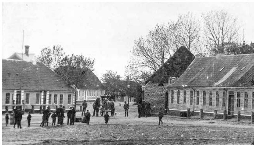
Torvet i Give o. 1900. Th. den nye kro med rejsestald i baggrunden. Tv. den gamle kro med Vestergade i baggrunden.