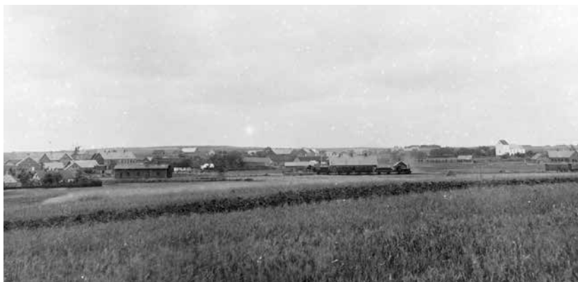
Give set fra Grønborg, ca. 1900. Toget er kommet til byen. Man kan se den lille stationsbygning forrest tv. og skimte de mange nye huse.

Stationen i Give ligger et par minutters gang fra byen. Medens man i Tørring tidligt begyndte at bygge ved stationen, går byggeriet i Give anderledes for sig. Der bygges rask væk oppe i byen, men nede ved stationen er der endnu ikke rejst nogen bygning.”