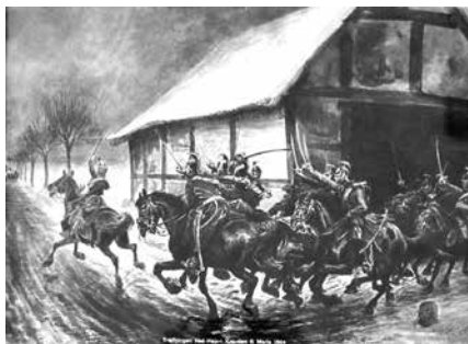
Ryttertræfningen ved Hjortsballe er så vidt vides ikke senere blevet afbilledet, som det er tilfældet ved mange andre træfninger under 1864 krigen. Her er det træfningen ved Højen Kro den 8. marts 1864.