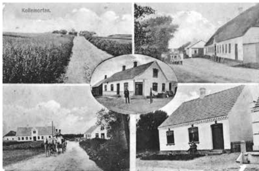
Partier fra Kollemorten By. Billederne viser Gl. Møllevej med mølle i baggrunden, Kroen, Brugsforeningen, hærvejen og et hus.