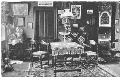
Den norske stue på Hjortsballe Kro ca. 1900.