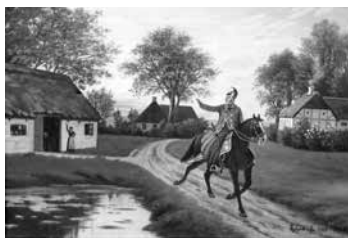
En dragon fra 1864 tager afsked med sin pige, mens han ridder bort. Nederst i højre hjørne står skrevet: Episode fra 1864. Den er signeret P. A. Petersen.