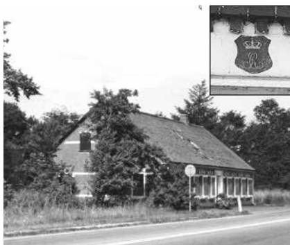
Hjortsballe Kro umiddelbart før nedrivningen i 2002. Kroen var en kongelig privilegeret kro, hvilket ses indsat som udsnit med Christian IX's monogram.

Den sejrige rytterfægtning ved Hjortsballe var et lille lyspunkt i den ellers så forsmædelige krig i 1864, der medførte, at Danmark måtte afstå hertugdømmerne Slesvig, Holsten og Lauenborg til sejrherrene Preussen og Østrig. Dermed reduceredes det danske monarki i sit areal med to femtedele og i sin befolkning med en tredjedel. Som et af de få positive min-